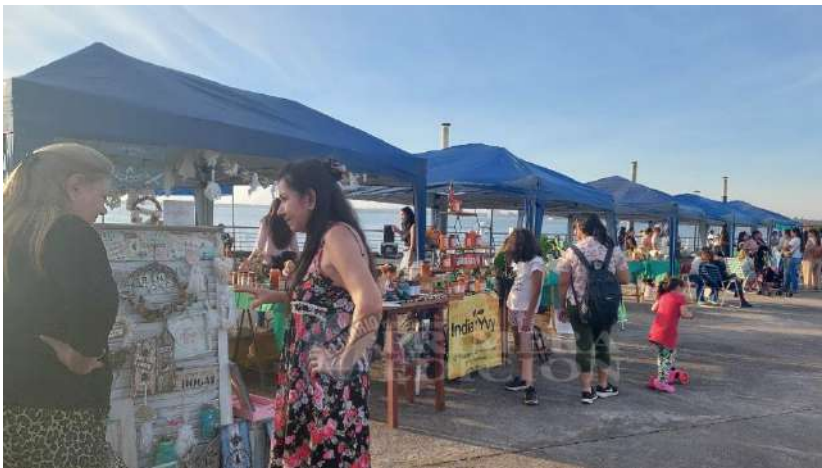
Imagen sector emprendedores

Resultados. Ecoferia Anual: Realizada el 5 de Junio de 2024 en la costanera de Posadas, plazoleta El Papa. Reunió a 60 emprendedores, 20 empresas, 20 instituciones públicas y diversas ONG. Además de stands, se incluyeron espectáculos culturales y artísticos. Movimiento Económico estimado de la venta de productos de emprendedores: 12.000.000$