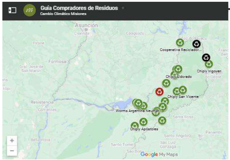
Imagen con las empresas compradores de residuos, georeferenciadas, y Link de la guía https://cambioclimatico.misiones.gob.ar/guia-compradores-residuos/