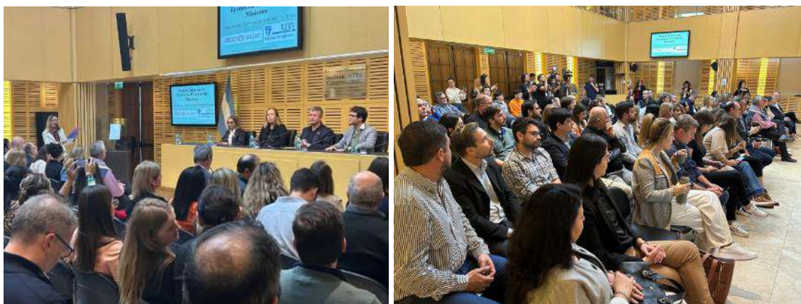
Foto Presentación del Informe en Legislatura, Salón Dos Constituciones

Link Informe: https://drive.google.com/file/d/1Gh2dorNnFqjUChA3W7-kBAO42Uq5aPnl/view