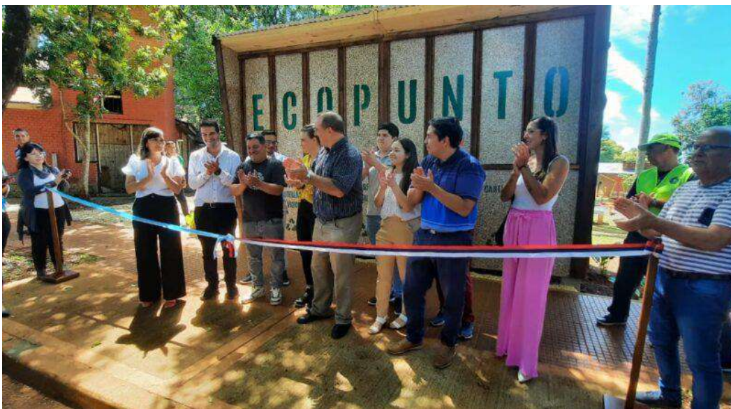
Imagen: Inauguración Ecopunto en Eldorado junto al Ministro Coordinador de Gabinete

Inicio y consolidación de Programas de Economía Circular en 8 Municipios de la Provincia de Misiones en 2024, y avance para el inicio de la construcción de 11 Ecopuntos en 10 municipios de la Provincia de Misiones en 2025, de los cuales 3 serán con fondos del sector privado. Si sumamos los Municipios de Posadas e Iguazú, que ya contaban con Ecopuntos, como así también 25 de Mayo y Aristóbulo del Valle que abrieron Ecopuntos con fondos propios, para finales del 2025, la Provincia de Misiones contará con 22 Municipios con Ecopuntos y Programas activos de Economía Circular.