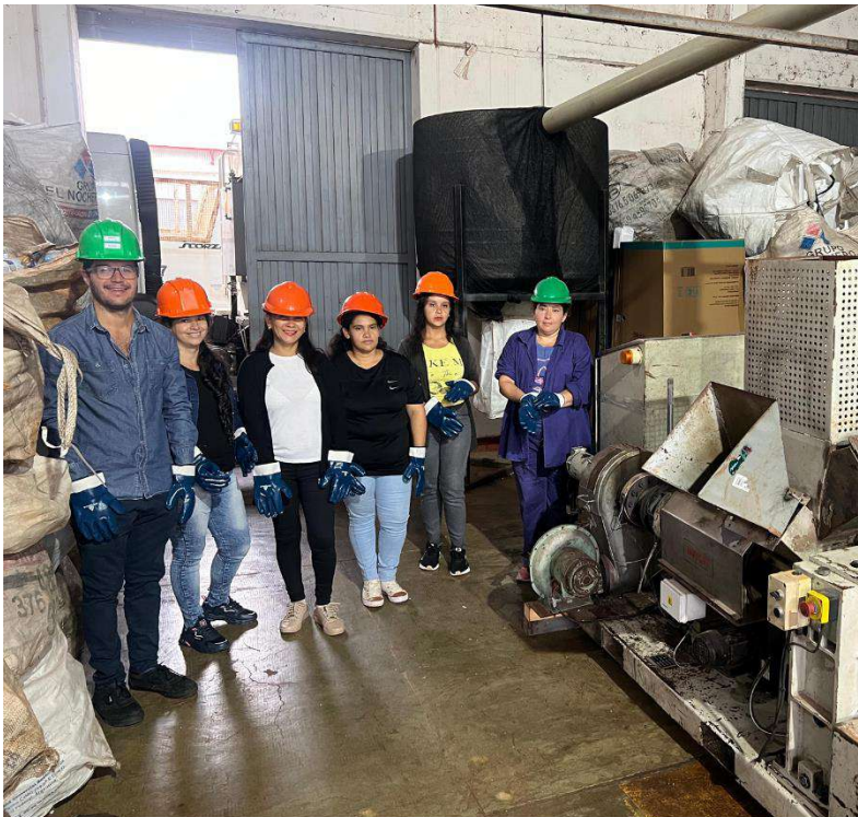
Imagen del Taller de Reciclaje junto a trabajadoras del Potenciar Trabaja.

Resultados. El proyecto ha logrado procesar residuos como el telgopor o poliestireno expandido, para convertirlo en alivianante de losa, como así también a polietilenos de alta densidad, para convertirlo en pellets para la fabricación de nuevas bolsas plásticas y madera plástica.