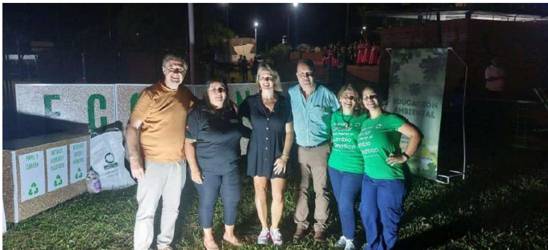
Imagen: presencia con stand en Fiesta Provincial Ecología, Campo Ramón, Enero 2024