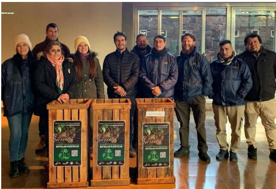
Imagen de una charla en Parque Temático Cruz de Santa Ana. Parte del ciclo organizado junto a Agua de las Misiones para personal de Parques Provinciales