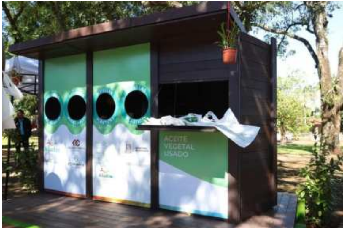
Imagen: Ecopunto donado por Arca Continental instalado en Eldorado