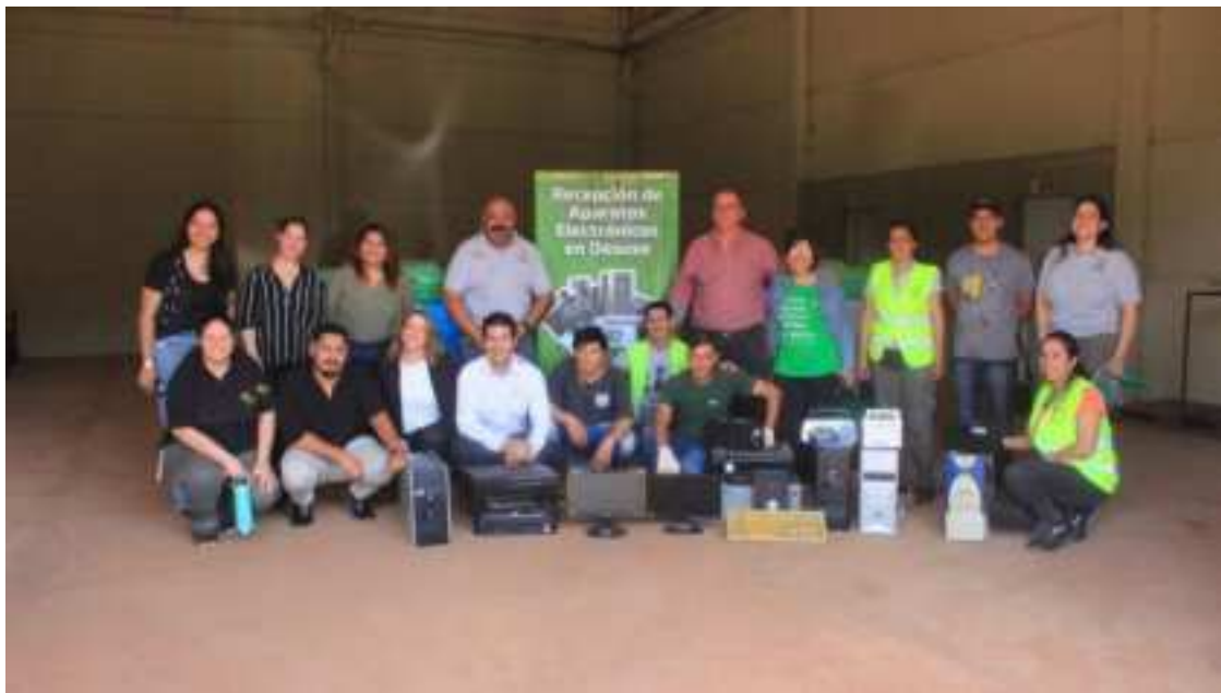
Imagen: Apertura CAT Eldorado

Se realizaron jornadas de recolección de aparatos electrónicos en desuso, en Alem, Eldorado, Apóstoles y Aristóbulo del Valle, facilitando que vecinos y organizaciones puedan entregar RAEE para su gestión responsable a la Cooperativa Nueva Esperanza de Reciclaje Electronico, con sede en la ciudad de Garupá.